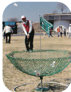
ターゲット・バードゴルフ

両端にボールがついたヒモをラダー (はしご)に向かって投げ、上手に 引っ掛けて点数を競うスポーツです。