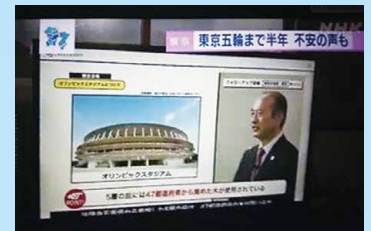
オンラインによるシティキャストフォローアップ研修「東京の地理・歴史」

会費、会則はなく、スポーツボランティア活動好きによるゆる～いネットワークです。1年後に延期された期間をコロナ禍でどのように過ごすかというそれぞれの想いで集まりました。約1年間、会場施設やコース理解、日本赤十字救急法、話し方、東京の地歴、国旗理解等さまざまなテーマでオンライン勉強会を行いました。講習会の講師、生徒、スタッフもメンバーです。その勉強会の中で、東京2020競技会場・コースオンラインツアーは4回実施しました。それは武蔵野の森総合スポーツプラザと武蔵野の森公園、国立競技場と東京体育館、お台場・青海・有明等の臨海地区会場施設、パラリンピックマラソンコースです。その後、パラマラコースの紹介が意外な展開となりました。