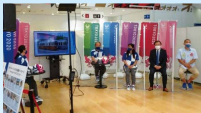
東京スポーツスクエアにて東京の魅力発信

東京2020競技会場紹介ツアー・パラマラソン編の取り組みについて、東京都オリパラ準備局から「東京・地域の魅力発信」の依頼があり、7月19日に有楽町にある東京スポーツスクエアで最初の配信を行いました。内容はパラマラコース紹介です。施設は、有楽町駅近くのビルに東京メディアセンターなどが設けられ、国内外から集まる取材陣がオンラインで行われる都主催の講演会などに参加します。