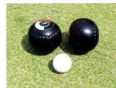
ボウルとジャック(白球)

認定NPO法人ローンボウルズ日本 関東支部では、主に昭和記念公園のローンボウルズコート(人工芝)や横浜のYC & AC(ヨコハマ・カントリー&アスレチック・クラブ)の素晴らしい天然芝のコートなどで活動しています。今年10月14日・15日・16日には、第5回ジャパンオープン国際大会が海外の国からの参加を含め、盛大に行われる予定です。また、普段は西立川の昭和記念公園などで一般の方々や高校生、大学生などと、体験会なども行っています。本場オーストラリアで研修を受けたスタッフが体験教室も行いますので、興味のある方はご連絡ください。