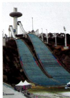
ピョンチャンのジャンプ台