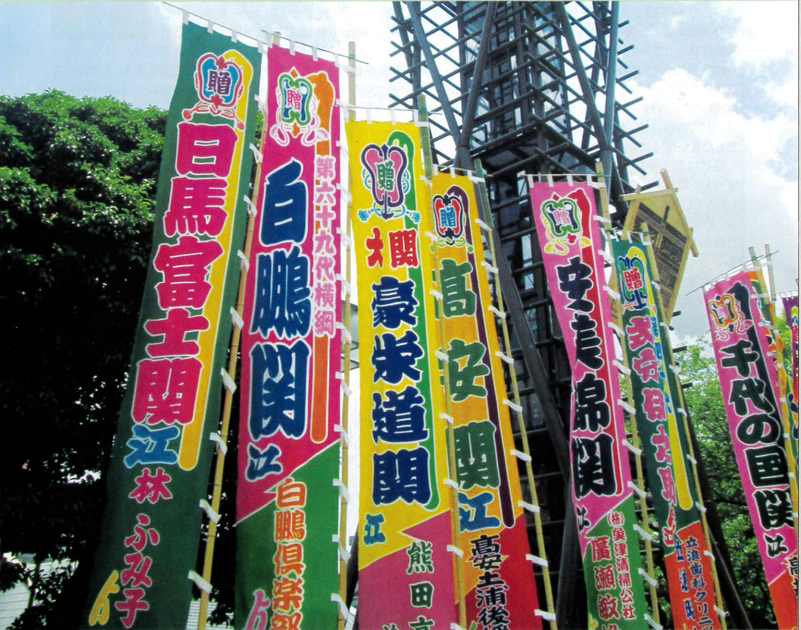
両国蔵前国技館前